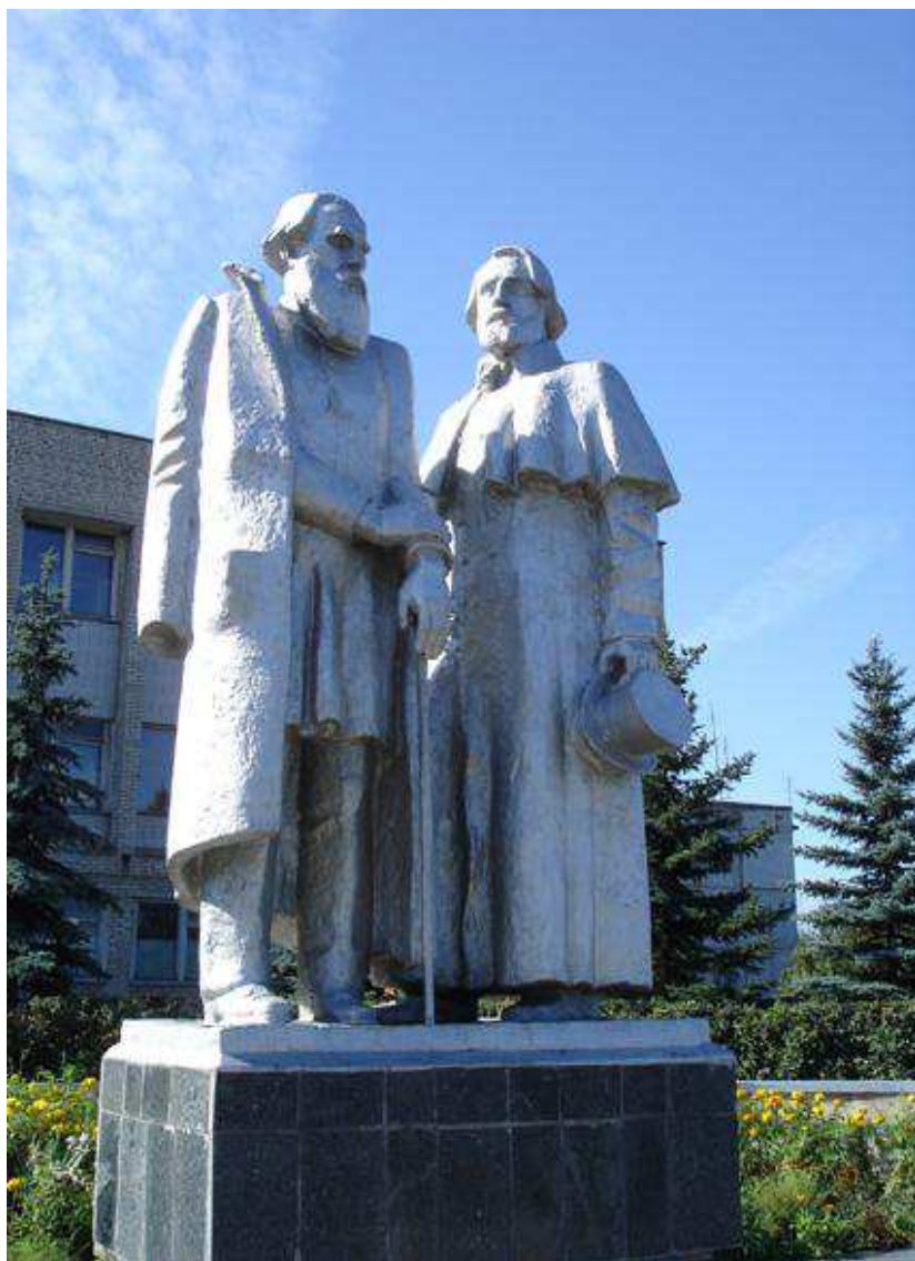
Памятник Льву Николаевичу Толстому и Ивану Сергеевичу Тургеневу в пос. Чернь, по дороге между Ясной Поляной и Спасским-Лутовиново. Авторы памятника –